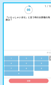
文字入力式 ひらがな・カタカナ 英語・数字